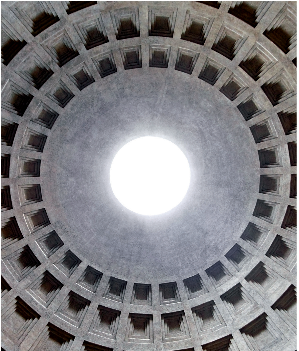
6 UNE ARCHITECTURE PARFAITE - COUPOLE DU PANTHÉON - ROME - 27 AVANT J.C.